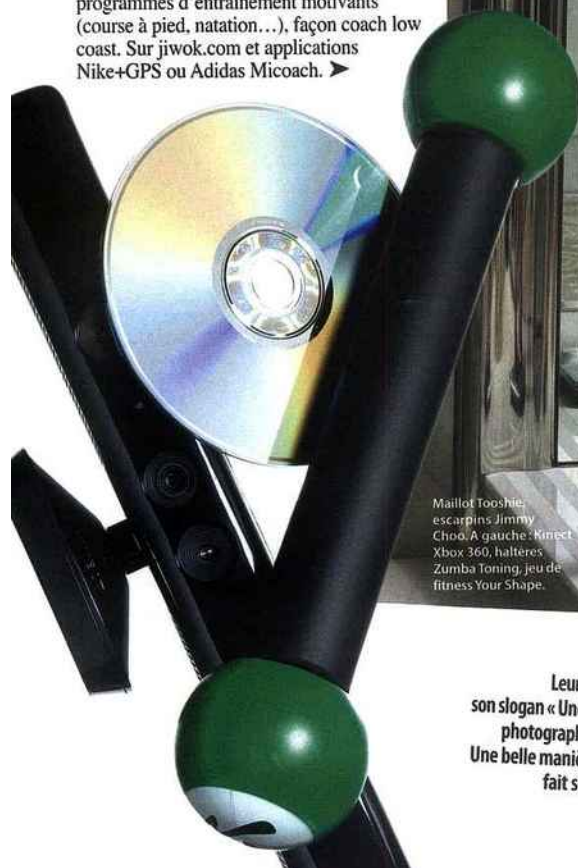
Maillot Tooshie, escarpins Jimmy Choo. A gauche : Kinect Xbox 360, haltères Zumba Toning, jeu de fitness Your Shape.

top (Nintendo.fr). Pour celles qui ne veulent s'encombrer de rien, il faut désormais compter sur la Kinect (accessoire malin à placer sur la Xbox 360). Avec elle, plus besoin de manettes, de socle ou autre, c'est la Kinect qui mixe capteur, caméra et micro grâce à un ingénieux système de rayonnement et de détection infrarouge : on est carrément dans l'écran. Le top ? Le jeu de remise en forme Your Shape : Fitness Evolved (49,99 € chez Ubisoft + 149 € la Kinect) qui propose, entre autres, cours de fitness, séances de hula hoop, exercices d'équilibre, etc. Nivea s'y est même associé pour développer des programmes d'enchaînements spécifiques, à combiner avec son gel Goodbye Cellulite (11,30 €***) pour un résultat encore plus flagrant. A tester également Kinect Sports pour s'essayer sans risque au tennis de table, course à pied, lancer de poids, etc. Et pour toutes celles qui avaient l'habitude de perdre leurs calories sur le dancefloor, mais qui sont coincées par la marmaille, les jeux Dance Central et Zumba Fitness sont parfaits pour retrouver le groove de ses vingt ans (45 et 40 €, Fnac et magasins spécialisés). Enfin, si l'on veut profiter de l'arrivée des beaux jours pour s'aérer, on télécharge sur son iPhone ou son MP 3 des programmes d'entraînement motivants (course à pied, natation...), façon coach low coast. Sur jivok.com et applications Nike+GPS ou Adidas Micoach. ►